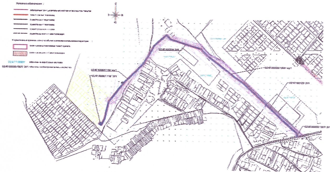
Чертеж межевания территории с отображением красных линий, линий регулирования застройки, границ земельных участков